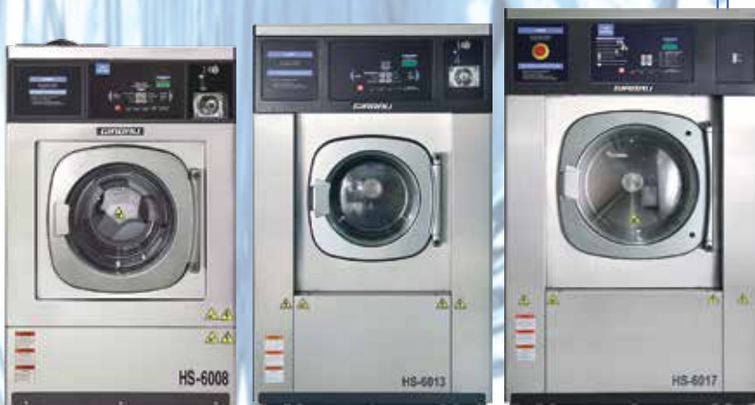
Girbau Washer Extractor

香港九龍官塘道396號毅力工業中心6樓E室 Flat E, 6/F, Everest Industrial Centre, 396 Kwun Tong Road, Kowloon