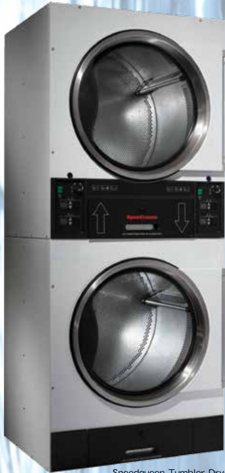
Speedqueen Tumbler Dryer / Vended Stack Washer/Dryer