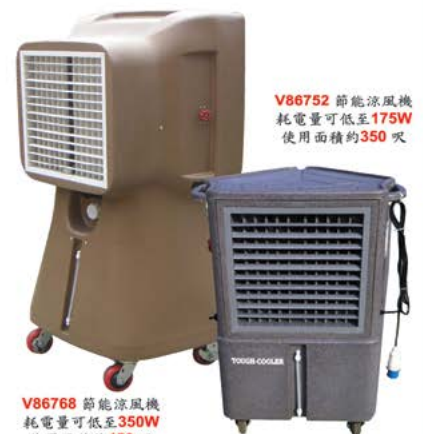
V86752 節能涼風機 耗電量可低至175W 使用面積約350呎