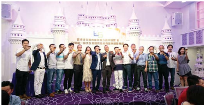
全體董事局成員上台祝酒

香港洗衣服務業聯會2017年9月9日五週年慶典暨全港第一屆洗衣業優秀技術員選舉頒獎典禮，已經完滿結束，當晚延開十席，氣氛熱鬧又開心。