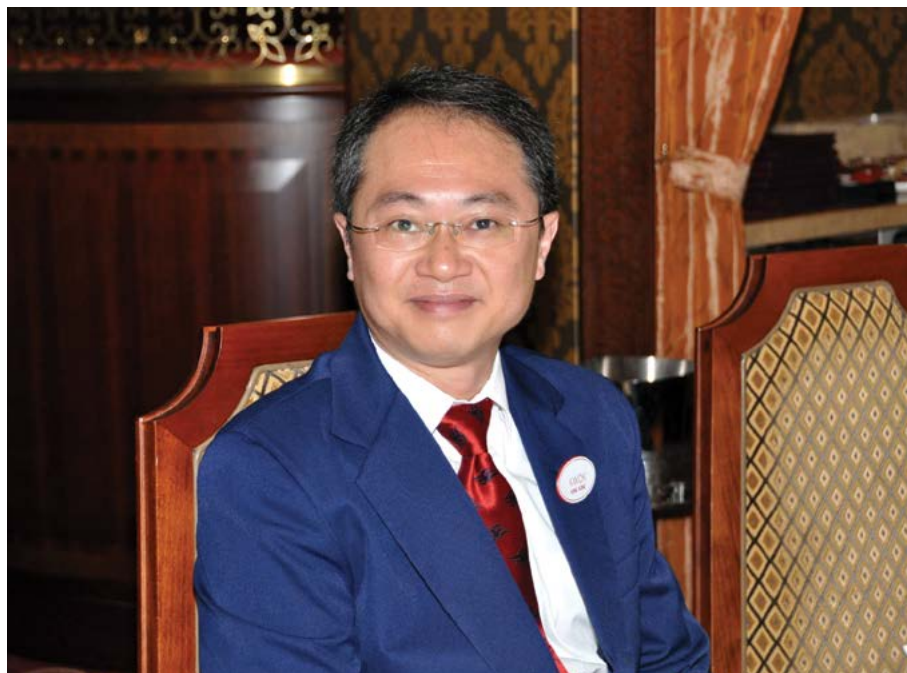
徐總監於洗衣行業理首工作接近30年，現已貴為行內翹楚。

多艘新郵輪，但值得注意的是，每一艘郵輪並不是copy & paste，基於科技日新月異，每一艘新郵輪都會有新科技、新設備，每一次都需要重新學習，這也是為徐師傅注入新動力之重要因素。