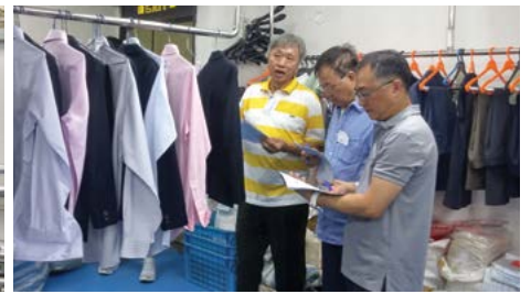
評判們在評審時一絲不苟