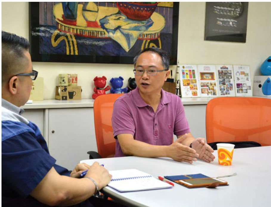
徐總監要做好每份工作，都是由心出發。

為何經常有新郵輪出現？全世界最美侖美奐的郵輪，都會被放置在美國邁亞美，而超過10年的郵輪均不可以留在邁亞美，目的旨在保護邁亞美的旅遊業及其名聲，故行駛超過10年的郵輪，只能行走二線航線如波士頓和紐約等地方，再過20年、30年，廠家就會將之賣給其他國家，再將這些收益再造新船和扣稅之用，所以，只要有新郵輪的出現，洗衣房就自然有存在的重要價值。