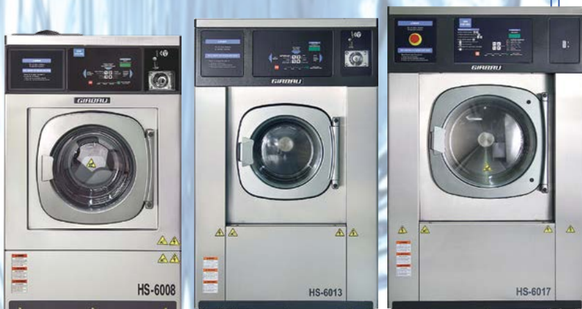
Girbau Washer Extractor

香港九龍官塘道396號毅力工業中心6樓E室 Flat E, 6/F, Everest Industrial Centre, 396 Kwun Tong Road, Kowloon