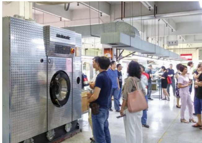
參觀深圳市偉易達洗滌服務有限公司廠房