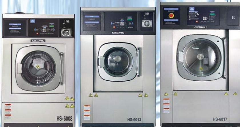
Girbau Washer Extractor

香港九龍官塘道396號毅力工業中心6樓E室 Flat E, 6/F, Everest Industrial Centre, 396 Kwun Tong Road, Kowloon