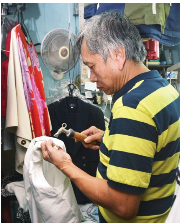
榮哥工作一絲不苟

「當時我會找洗衣廠為我的牛仔褲進行洗水的工序，和一定位於黃竹坑的洗衣廠房有很多生意上的往來。後來和洗衣廠的老闆熟絡後，他便邀請我回港到洗衣廠幫忙，那時候我記得是84年。如果算起來，那是我正式加入洗滌行業。後來過了一段時間，有一位跟我很要好的伯父退休，便讓我接手這家『美麗華』，一直到現在。」