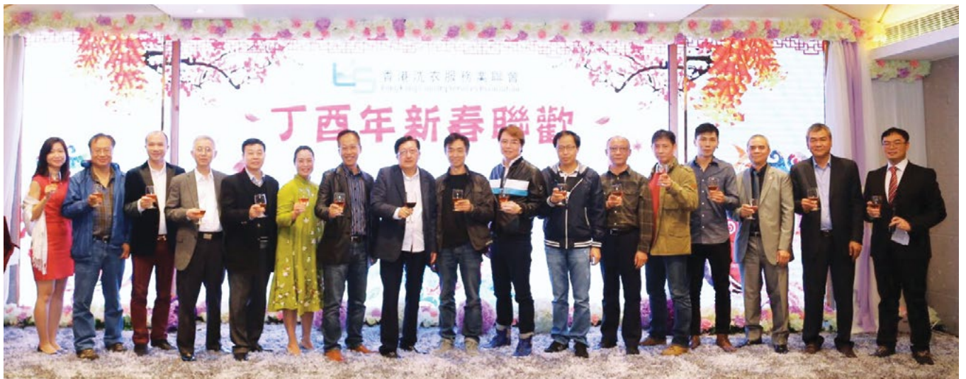
全體董事局成員與嘉賓祝酒