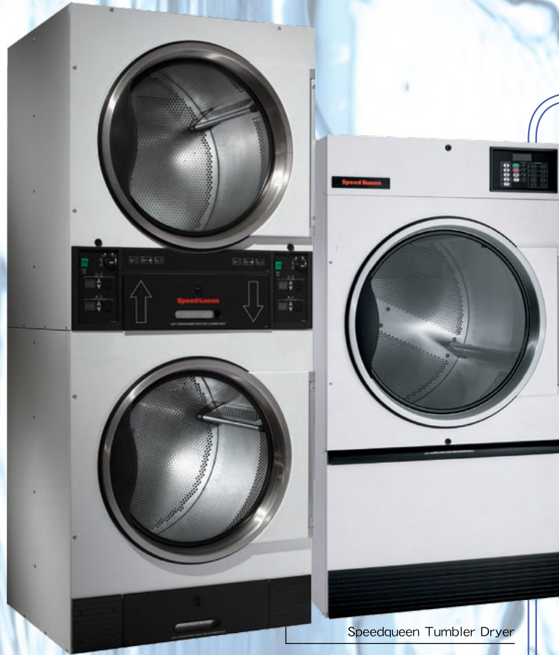
Speedqueen Tumbler Dryer