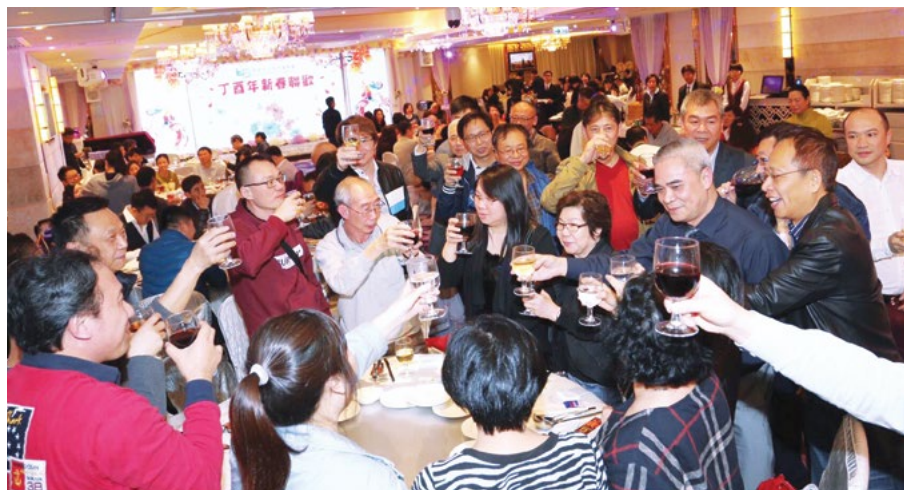
董事局成員向嘉賓敬酒

為了感謝一班洗衣業界的老前輩，別邀請了他們來參加晚宴，很高興今年有超過22位洗衣業界的老前輩出席，接受大家祝福，衷心多謝這班老前輩為我們洗衣業界作出的貢獻。