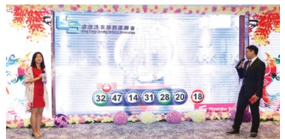
現場六合彩攪珠，似模似樣