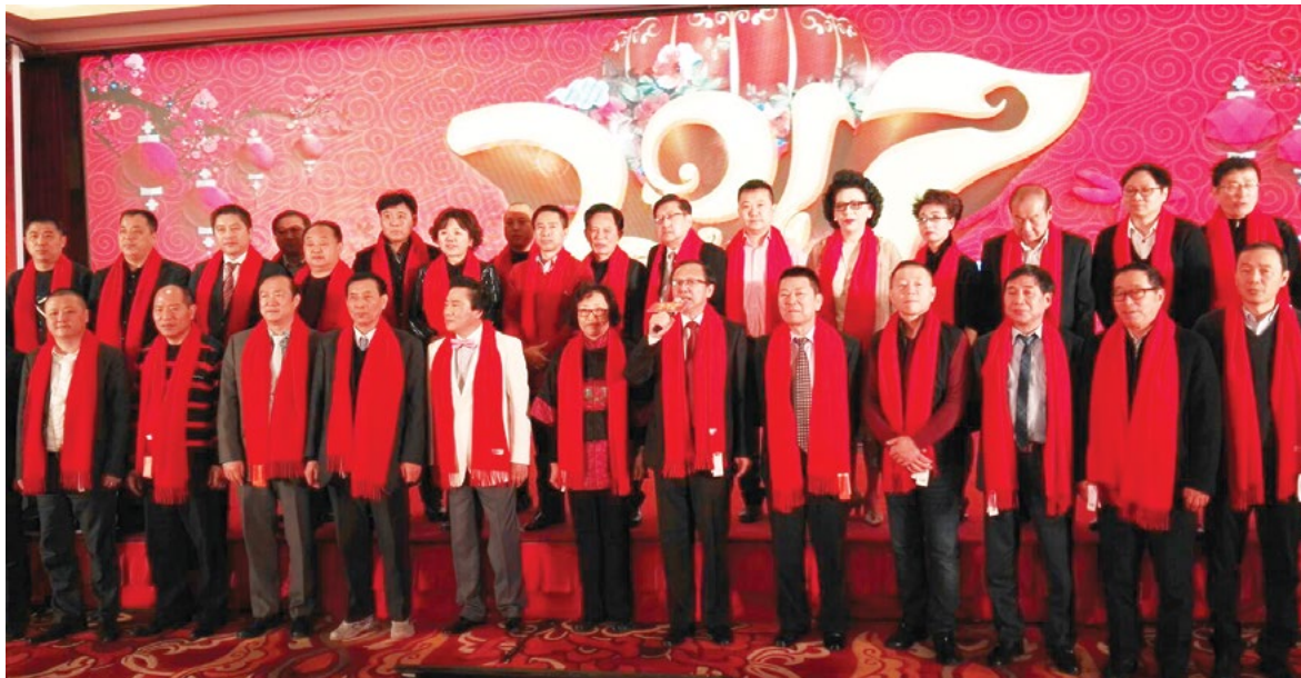
第五次全國洗染行業協會聯席會議全體合照