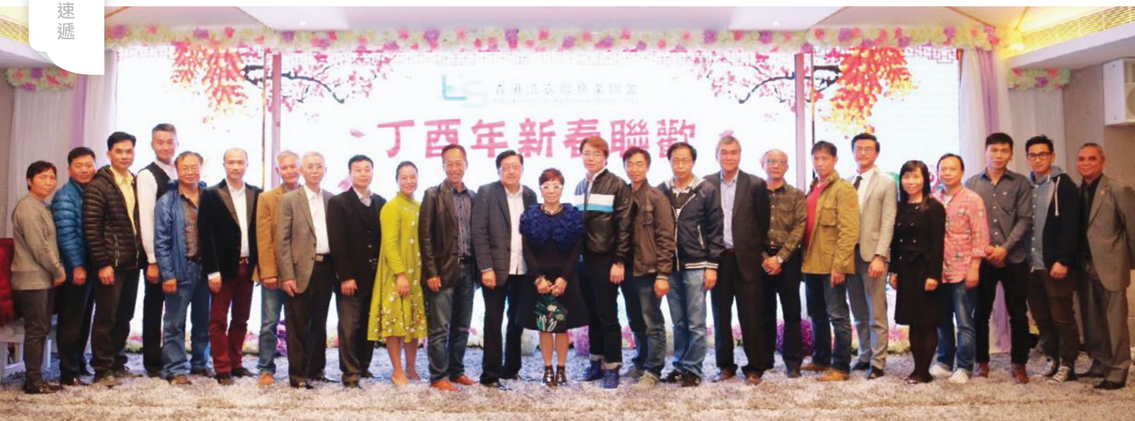
一眾贊助開心善款的善長大合照

今年聯會特別邀請了表演嘉賓，令晚宴更加精彩熱鬧，有超過20年表演經驗的魔術師，除了表演還有和現場觀眾互動著，教觀眾玩魔術。