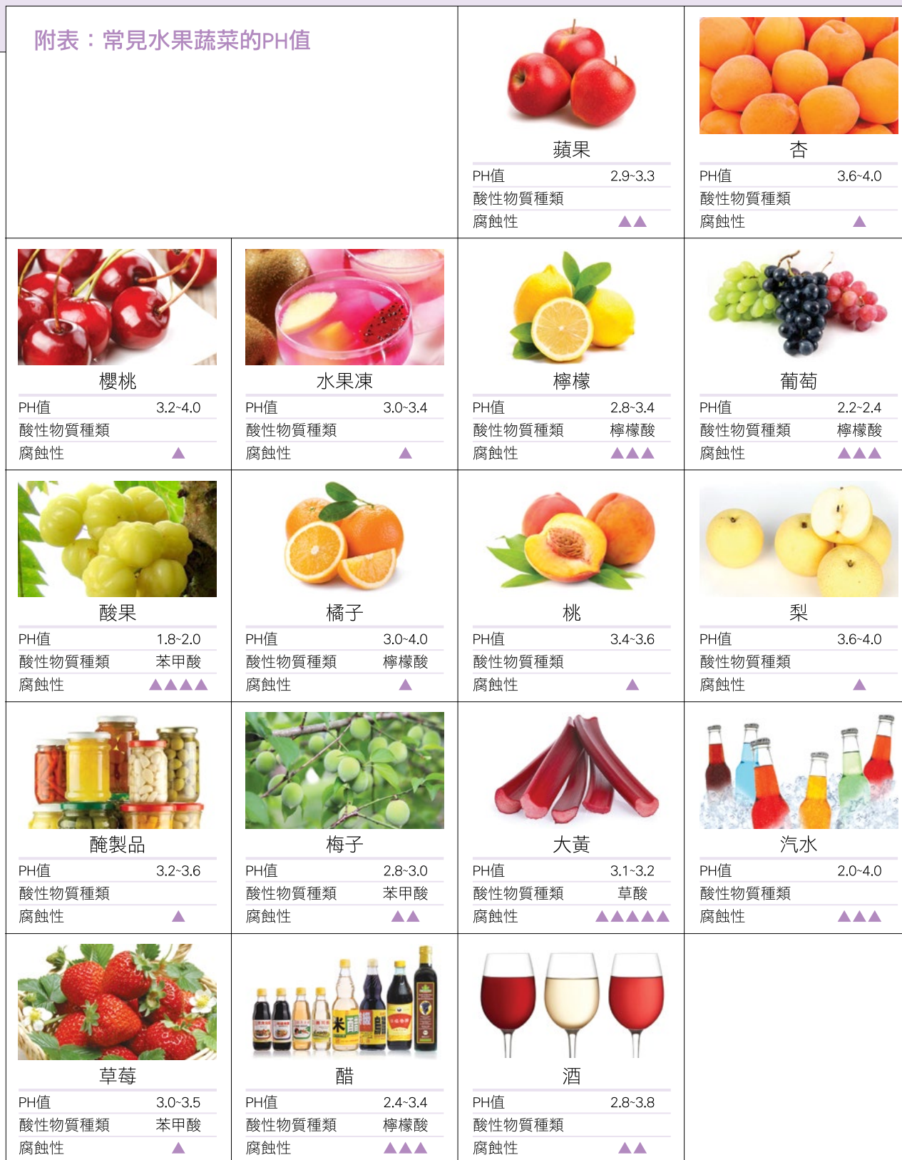
附表：常見水果蔬菜的PH值