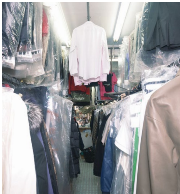
店內長期放滿客人的衣服