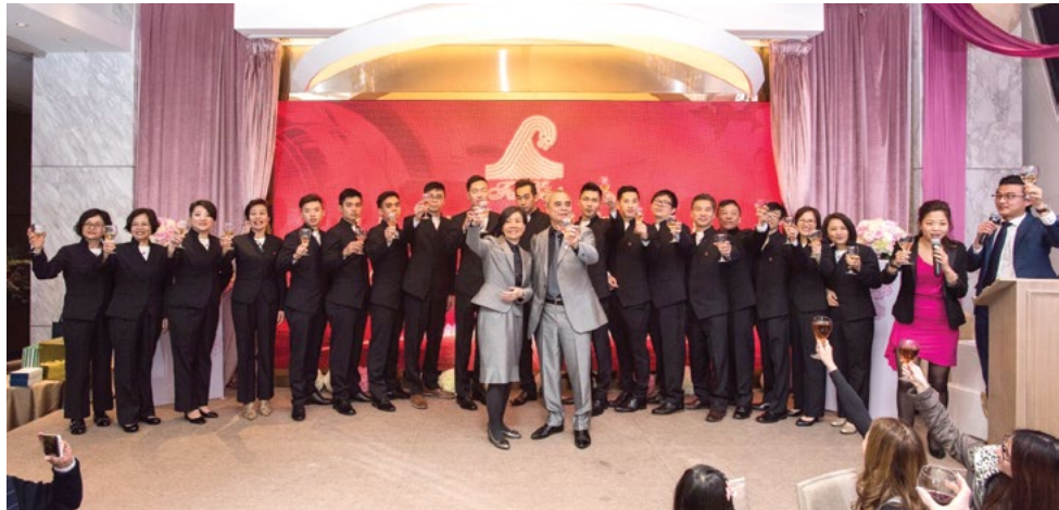
遠東乾濕洗集團向到場的晚宴來賓祝酒