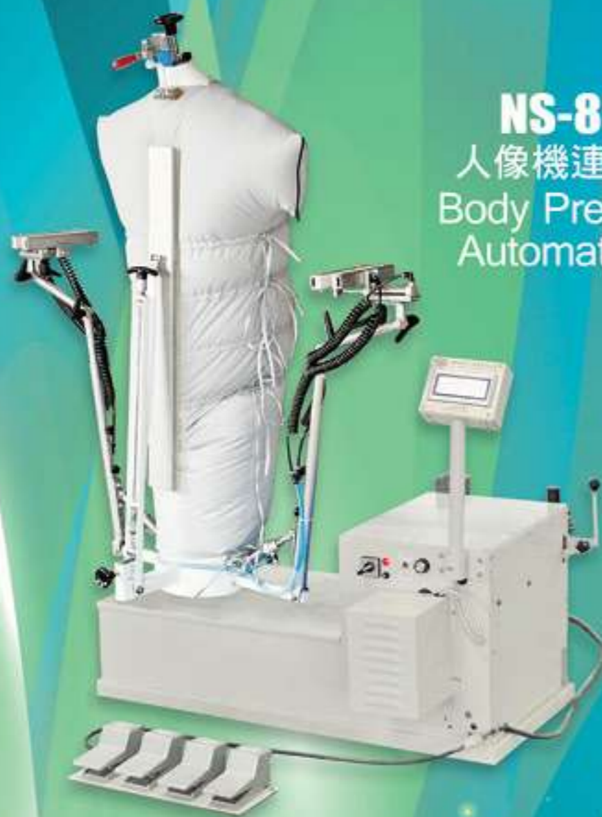
NS-8514 人像機連自動夾 Body Press With Automatic Clip

Ngai Shing Development Limited 藝誠(余氏)發展有限公司