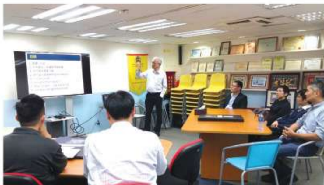
出席的會員對光污染議題表示關注