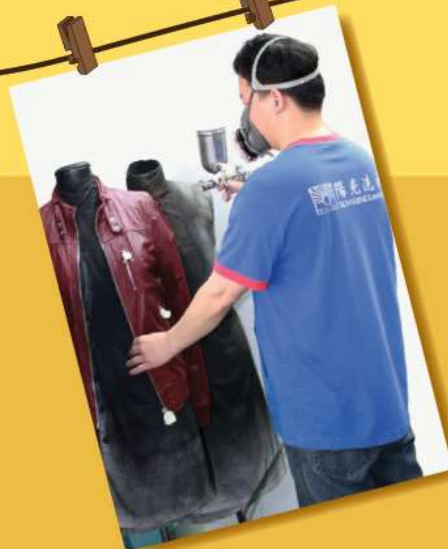
專業皮革護理服務 Professional Leather, Fur Dyed & Care