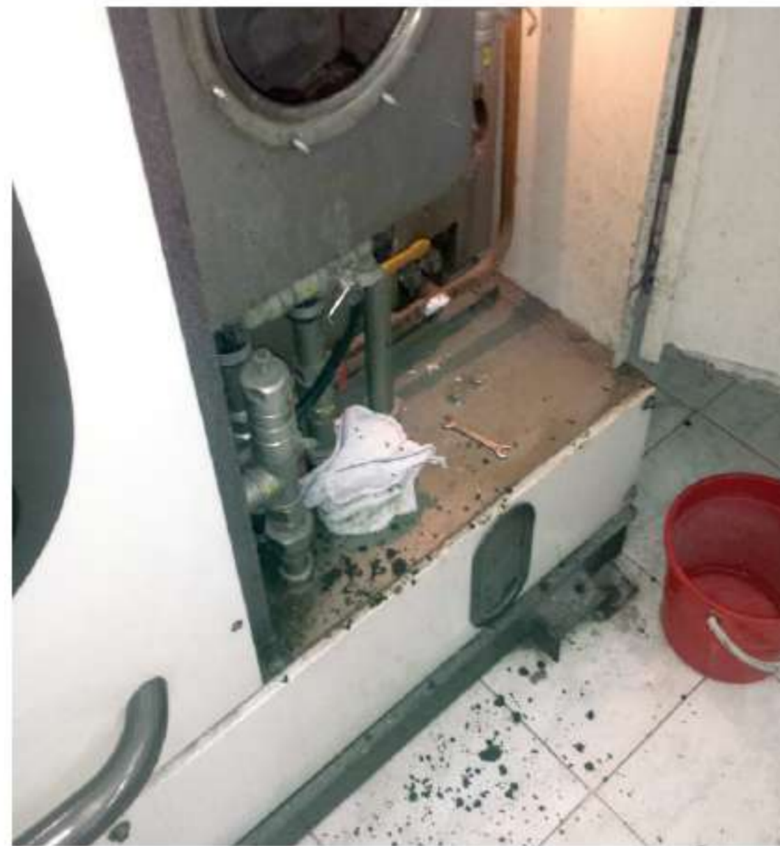
油水分離器須定期清理，否則會發臭