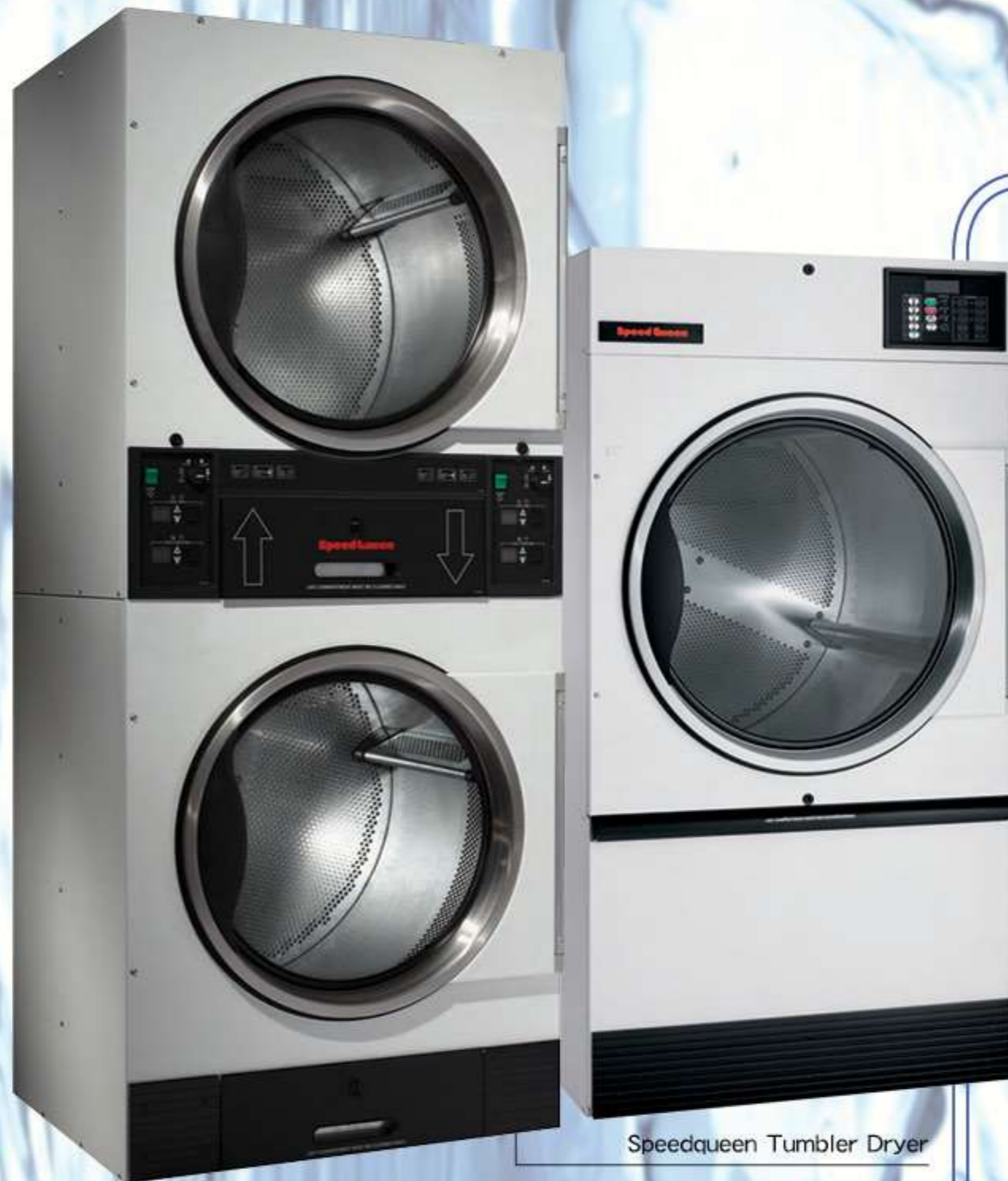
Speedqueen Tumbler Dryer