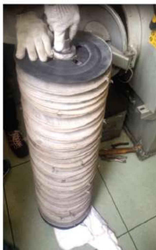
清洗乾淨後的尼龍濾芯