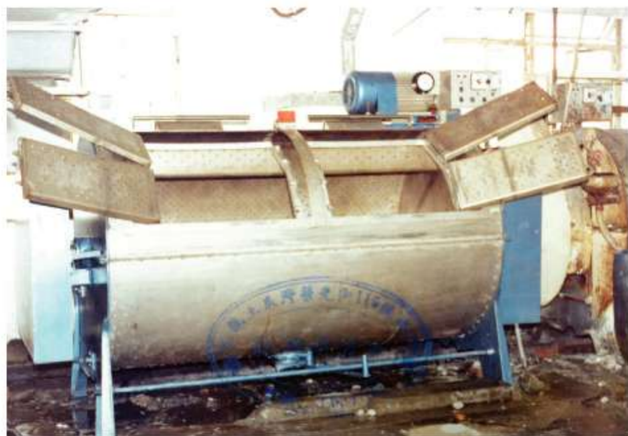
經改良的石磨牛仔褲洗水機，門改為側開，開啟時更安全