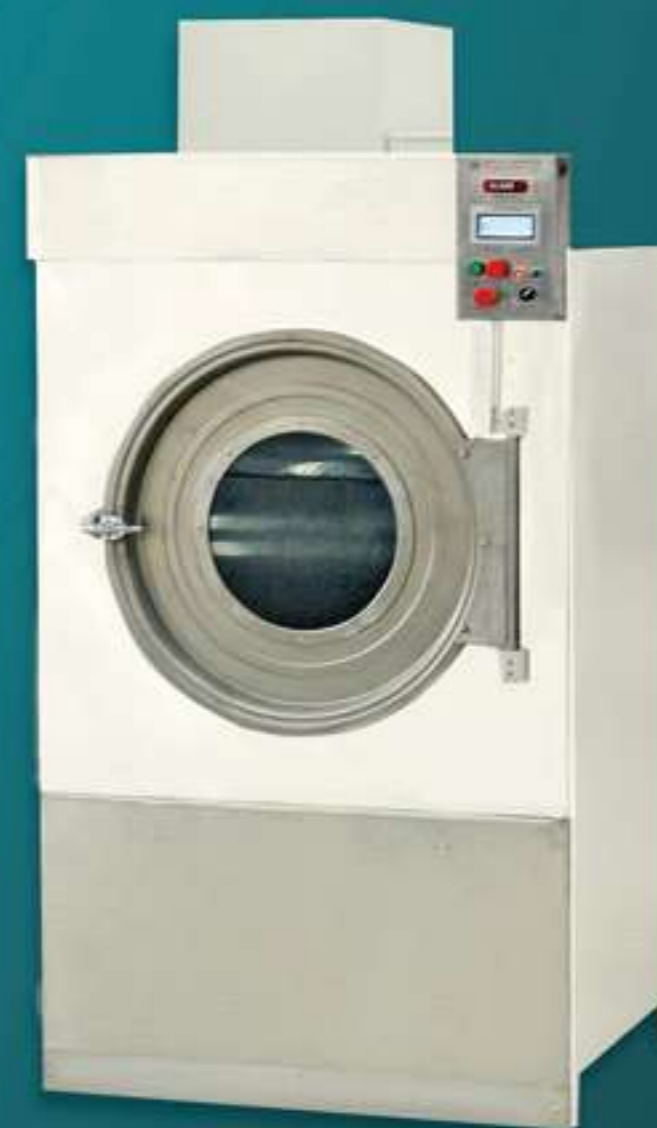
UNI.2800-40 工業乾衣機 Industrial Drying Tumbler