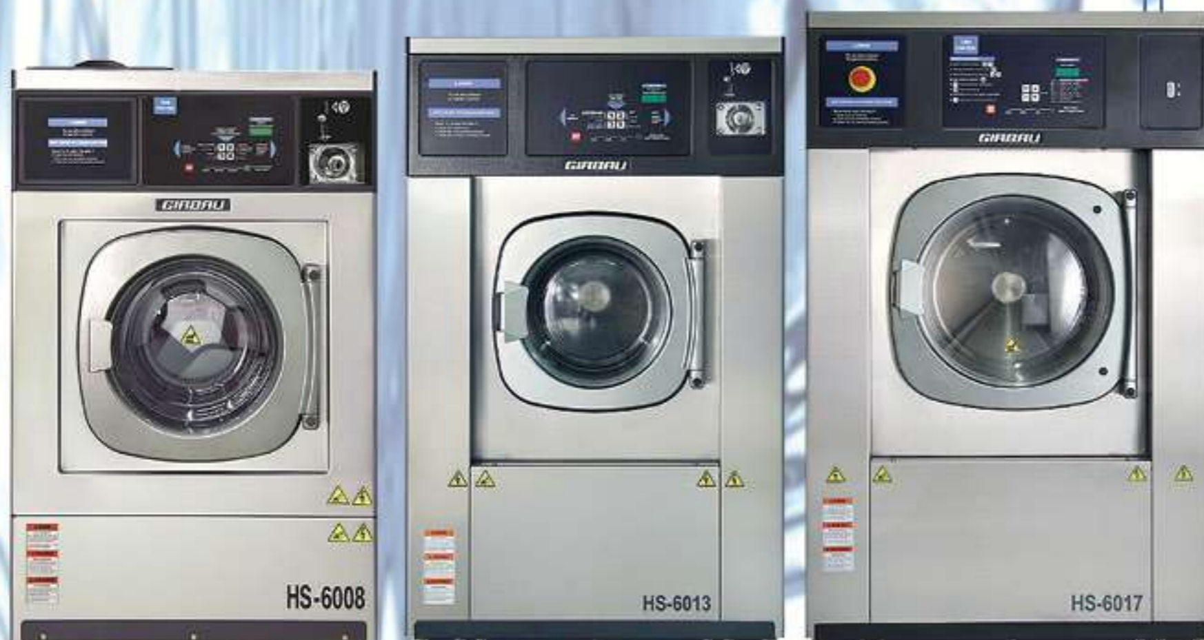
Girbau Washer Extractor

香港九龍官塘道396號毅力工業中心6樓E室 Flat E, 6/F, Everest Industrial Centre, 396 Kwun Tong Road, Kowloon