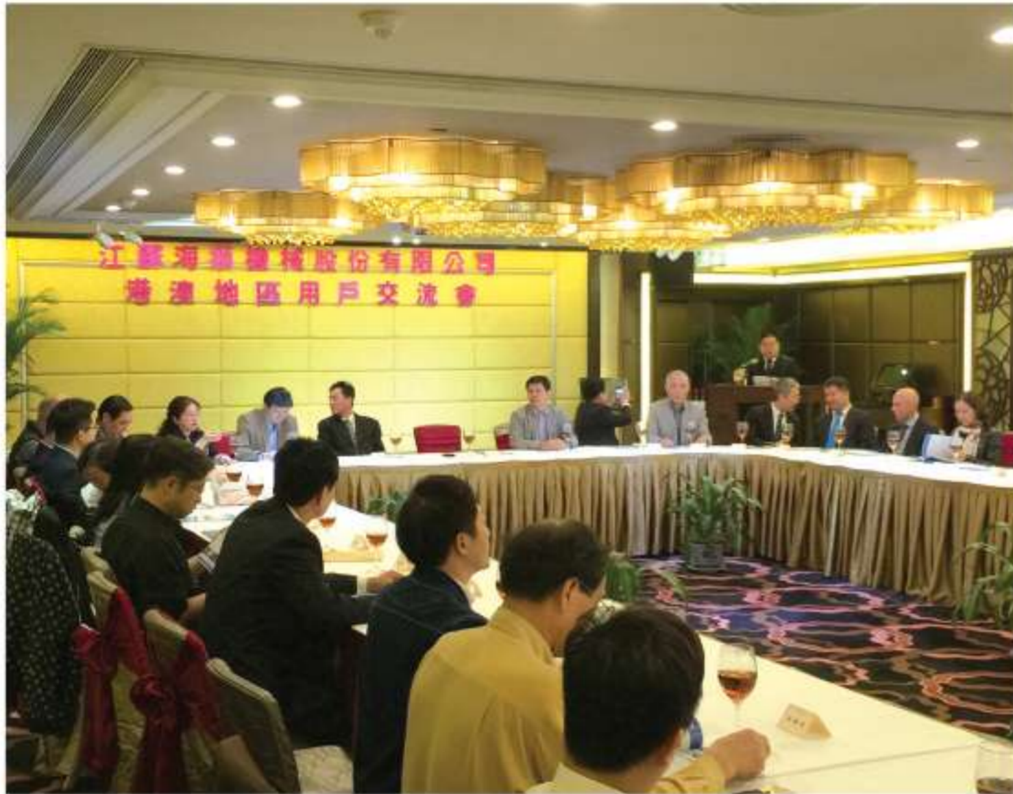
來自澳門、內地及香港的洗衣業界代表均出席是次會議