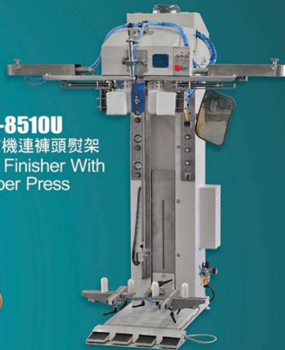
NS-8510U 褲像整熨機連褲頭熨架 Trousers Finisher With Topper Press