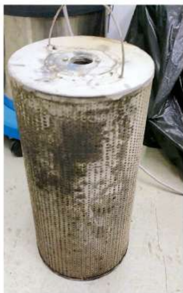
換出來的紙碳過濾芯