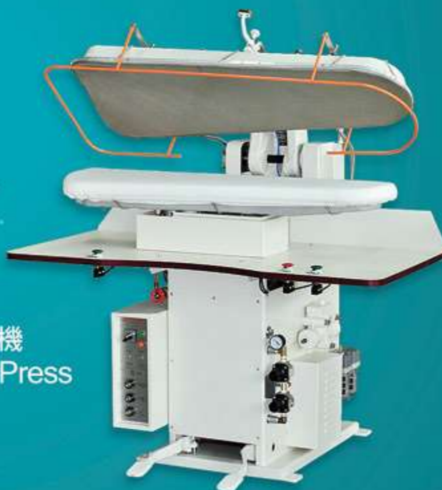
NS-7218 自動萬能壓平機 Automatic Utility Press