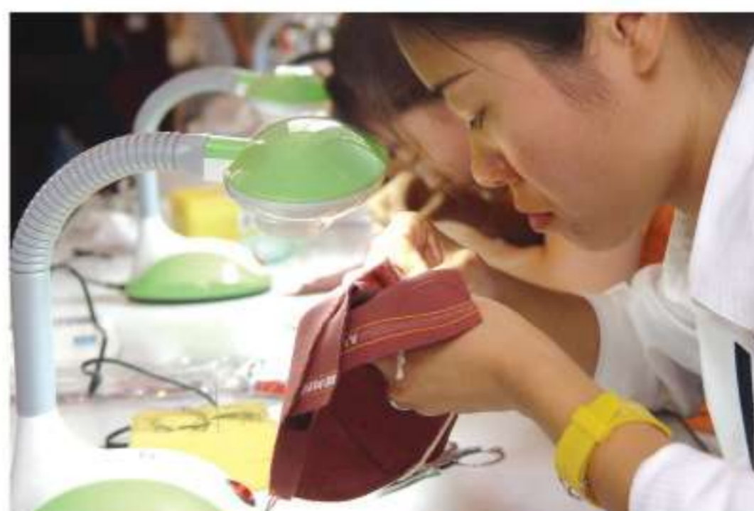
全國洗染業職業技能競賽