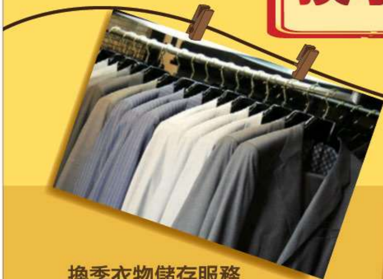
換季衣物儲存服務 Seasonal Clothing Storage Service