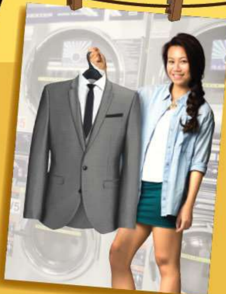
專業乾洗服務 Professional DryClean Service