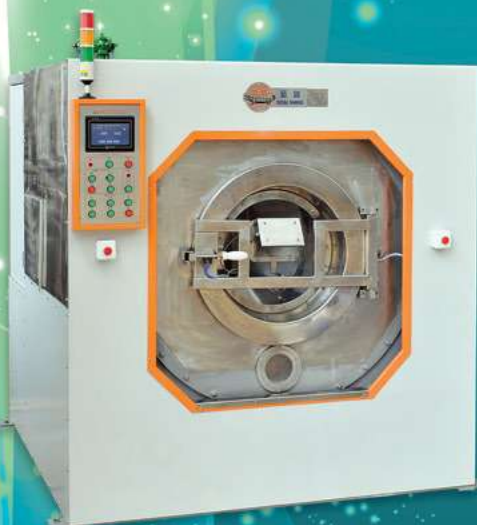
NS-2270-80 自動洗衣脫水機 Automatic Washing Extractor